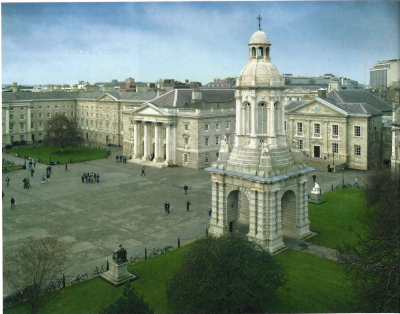
Årets møte ble holdt på ærverdige Trinity College i Dublin.

Fra Norge ble det meldt om at viruset finnes langs hele kysten, og sannsynligvis er et økende problem. Som fra Skottland ser man også i Norge utbrudd på mindre fisk. I en datainnsamling som involverte 6 generasjoner av fisk – totalt 545 fiskegrupper - utsatt i perioden 2012-14, ble risikofaktorer for utvikling av CMS undersøkt. Dødelighet over 0,1% ble i undersøkelsen ansett som et klinisk utbrudd. Noe av det som ble konkludert med var at daglig risiko for sykdom øker ved antall dager i sjø, og at større fisk er mer affisert enn liten. I tillegg gir PD- og HSMB-dødelighet økt risiko for CMS, selv om man konkret for området Hardanger så lite CMS-sykdom i fjor til tross for at området er sterkt infisert av PD.